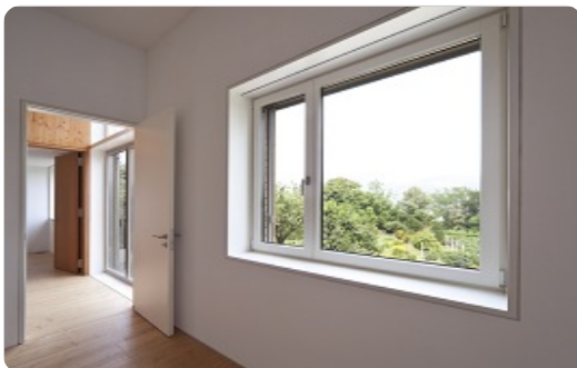
Neue Fenster aus Polen

Fakt ist, dass man aus Polen billige Fenster kaufen kann. Billige Fenster kann man jedoch auch in Deutschland kaufen. Gemeinsam haben beide billigen Fenster, dass sie häufig nur über eine geringe Lebensdauer verfügen und oft den Ansprüchen an den U-Wert für eine energetische Gebäudesanierung nach Energieeinsparverordnung (EnEV) 2014 nicht genügen, oder zumindest nicht förderfähig sind.