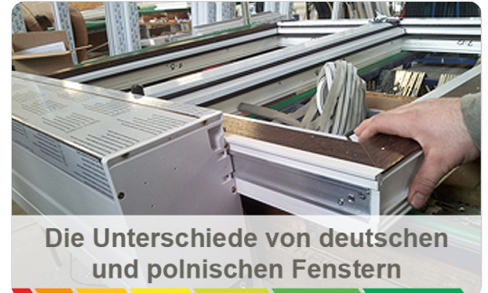
Fensterproduktion in Polen | © WIN-BUD S.C. Fensterhersteller

Wir haben Ihnen diese Arbeit einmal abgenommen. Erhalten Sie hier wichtige Informationen zu den Fenstern aus Polen.